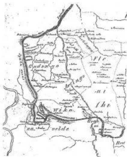
Die Gau-Einteilung der Diözese Hildesheim um das Jahr 1000 (nach Löntzel) (18) Ausschnitt